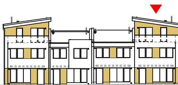
pohled na dům od západu