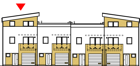
pohled na dům od východu