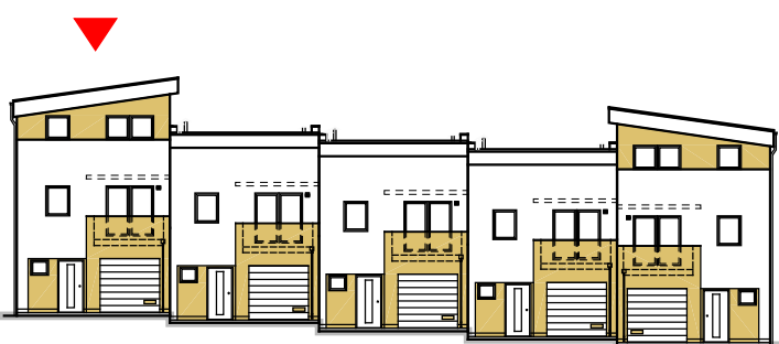
pohled na dům od východu