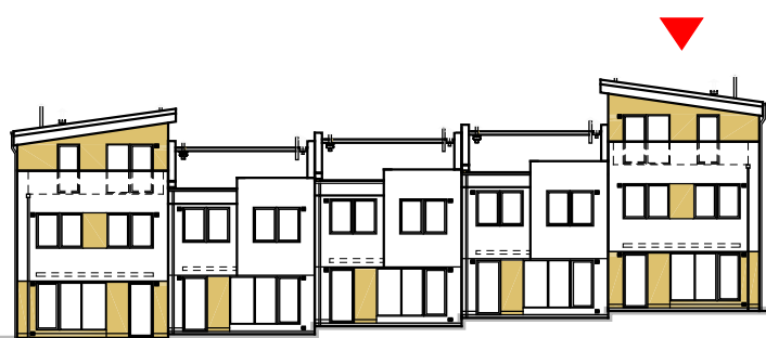
pohled na dům od západu